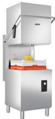
Zmywarki profesjonalne - Grand Series - Easy Line - Zmywarki kapturowe GEX-H500