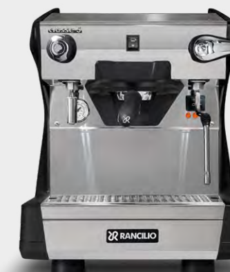
C5 S 1 GR TALL