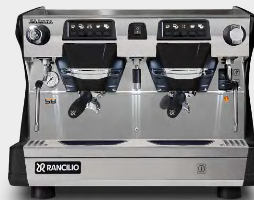
C5 CRONO 2GR COMPACT