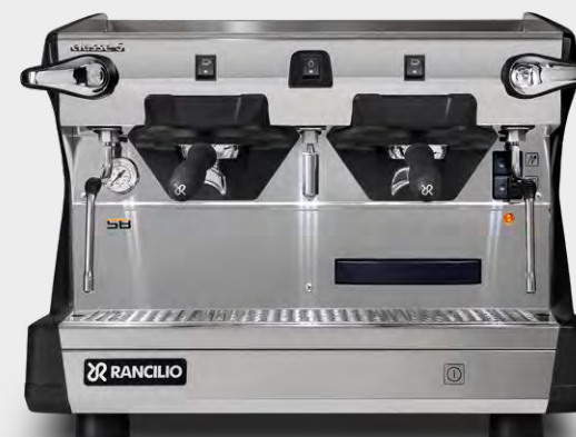
C5 S 2GR COMPACT TALL