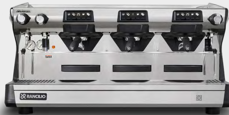
C5 CRONO 3GR TALL