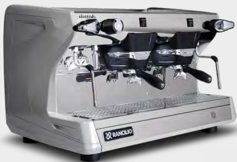
CLASSE 5 S