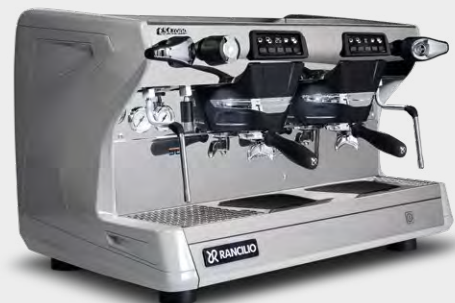
CLASSE 5 CRONO