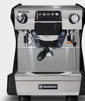
C5 CRONO 1 GR